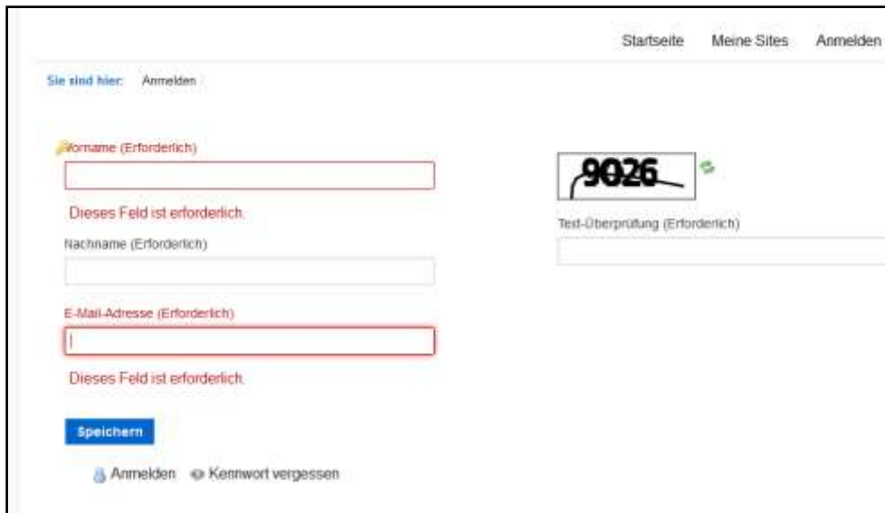
Abbildung 2: Registrierung

Nach Erhalt der E-Mail können Sie sich über anmelden am Portal anmelden und werden zur Eingabe eines neuen Passwortes aufgefordert. Dieses ist zu wiederholen. Nach dem Lesen und der Bestätigung der Nutzungsbedingungen sind Sie auf dem Portal als regulärer Nutzer angemeldet.